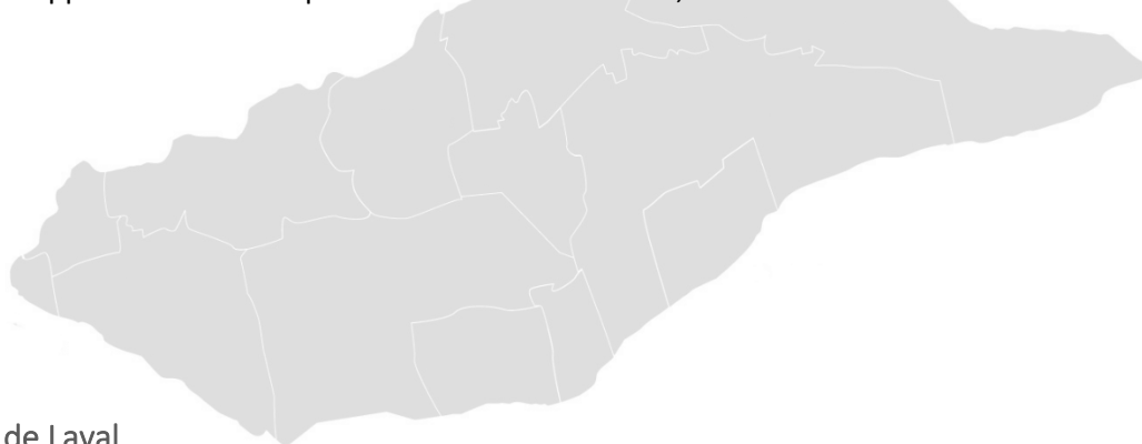
Tableau 12 : Ville de Laval

La ville de Laval est aussi en processus de préparation de sa politique d'économie sociale, ceci montre l'importance que cette ville accorde à la contribution de ce secteur aux enjeux de développement socioéconomique de son territoire. En effet, le Pôle régional d'économie sociale de Laval (PRESL) a été mandaté pour préparer cette politique. D'ailleurs, selon un communiqué émis lors de l'annonce de ce mandat, la ville de Laval a déclaré que dans le cadre de sa vision stratégique de développement économique du territoire 2023-2027, elle reconnaît le PRESL comme un partenaire économique 68 .